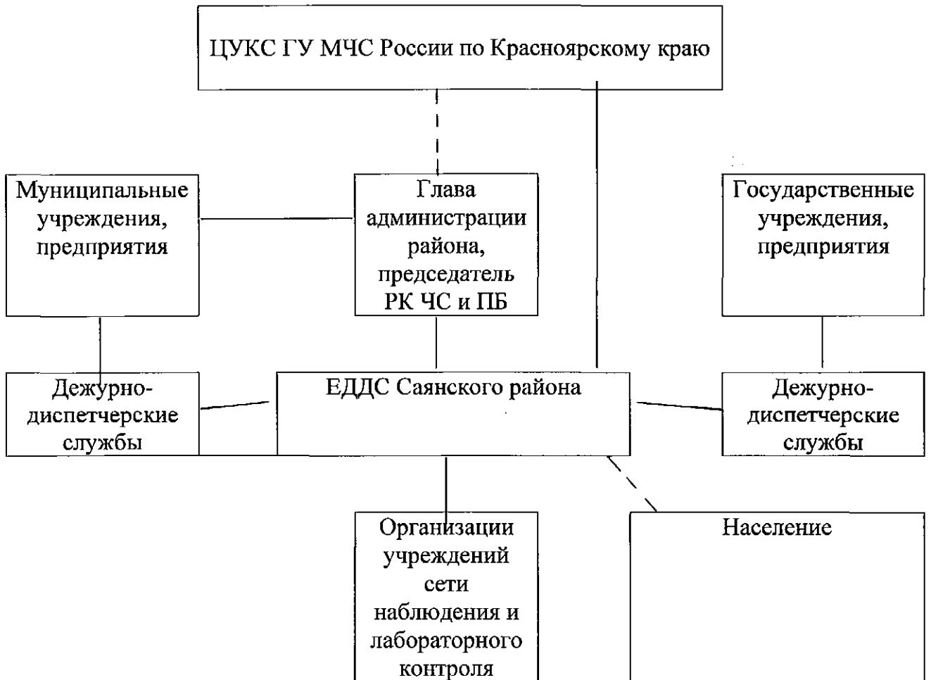
СХЕМА организации управления и взаимодействия Единой дежурно-диспетчерской службы Саянского района