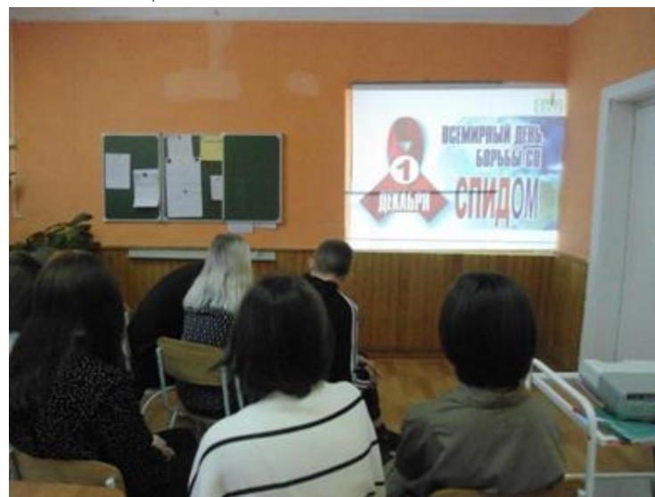
Акция «СТОП. ВИЧ. СПИД»