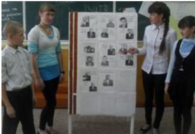
Никто не забыт, ничто не забыто