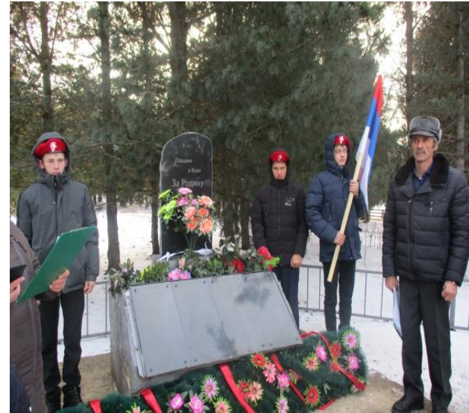
Акция «Великие люди великой победы»