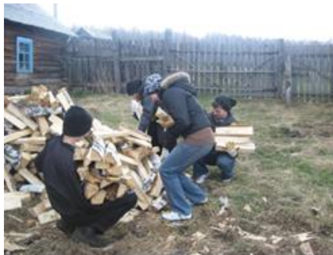
Акция «Весенняя неделя добра»