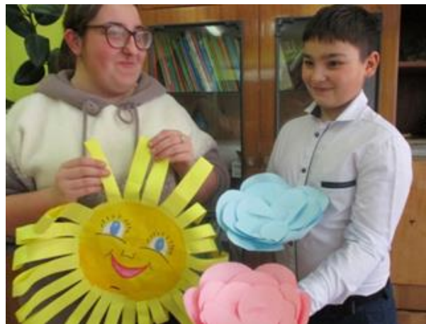
Акция «Доброе сердце(помощь детям с ОВЗ)»