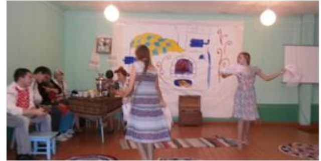
Немецкая национальная гостиния