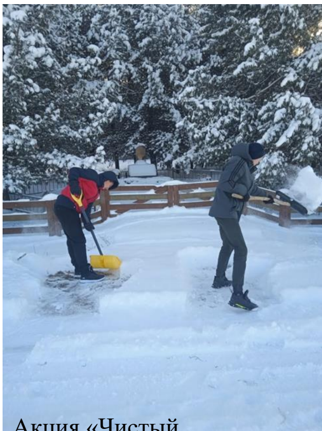
Акция «Чистый памятник»